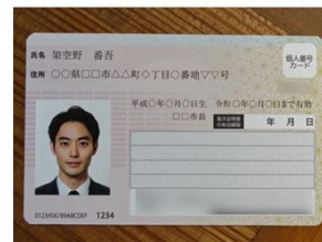
マイナンバーカードは 「性別」「臓器提供意思」をマスキング