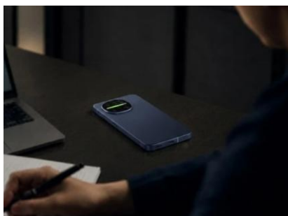
灯りと音が連動して空間演出（イメージ）

本体は、三宅 一成氏が設立した「miyake design」がデザイン。カメラリング部は、円でも四角でもない“自由曲線”が印象的なデザインを継承しています。光沢感のあるガラス素材と丸みを帯びたフォルムで、手に馴染みやすくシンプルながらも上質感のあるデザインです。カラーは個性が際立つ3色をラインアップしました。